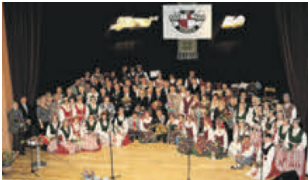
Prieš dešimt metų ansamblis „Jūra“ šventė savo aukštinį jubiliejų – 50-metį. Ansamblio dalyviai, vadovai ir svečiai po jubiliejinio koncerto