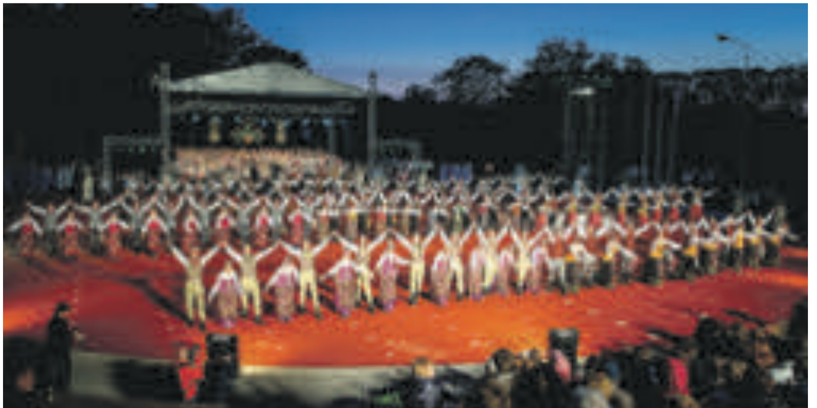
Tauragės kultūros centras, Lietuvos nacionalinis kultūros centras ir ansamblis „Jūra“ yra respublikinių ansamblių vakarų organizatoriai ir rengėjai. Ansamblių vakaras Tauragės vasaros estradoje 2015 m.