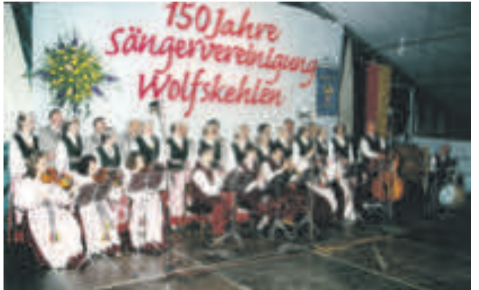
2000-aisiais m. ansamblis trečią kartą lankėsi ir koncertavo Vokietijoje, Rydštate