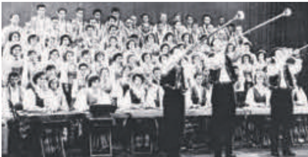
Taip atrodė „Jūros“ ansamblis 1961 metais