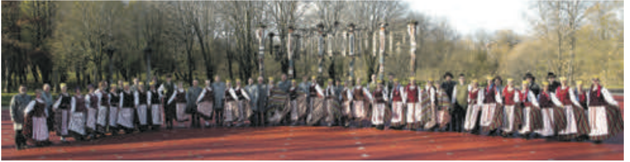
„Jūra“ šiandien - stiprus ir žinomas Lietuvoje meno kolektyvas, nuolatinis respublikinių Dainų švenčių dalyvis, vyriausias meno kolektyvas Tauragėje