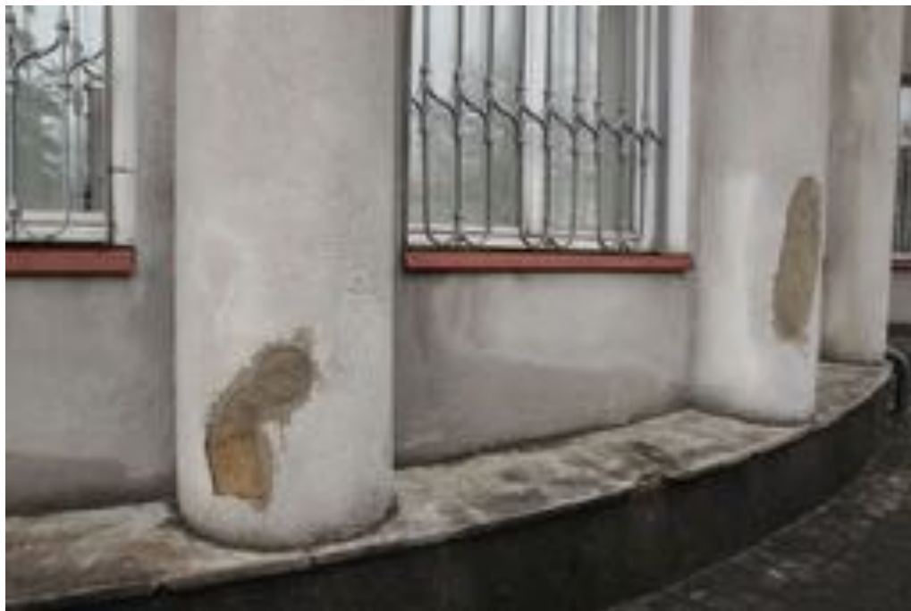
Nr. 5 Pavadinimas Banko pusapvalės kolonados puskolonės iš ŠV, nuo kurių atšoko tinkas 2017-12-01