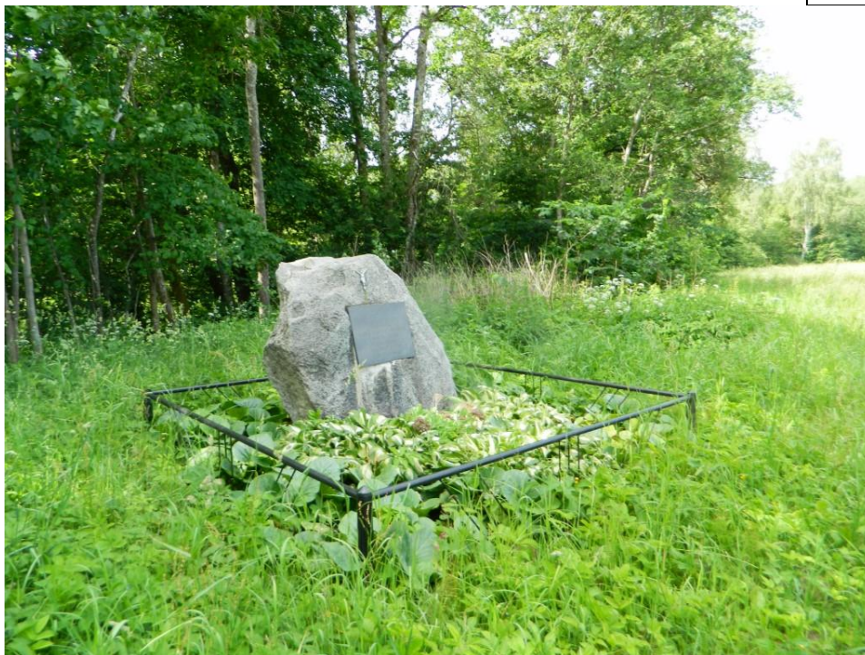
Nr. 1 Pavadinimas Lietuvos partizanų kautynių ir žūties vietai skirtas paminklas iš Š Data 2018-06-06