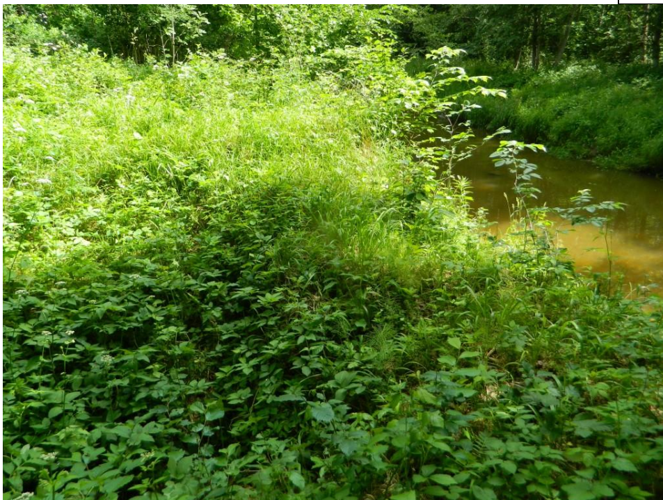
Nr. 2 Pavadinimas Lietuvos partizanų kautynių ir žūties vieta (matyti slėptuvės-bunkerio vieta) Data 2018-06-06