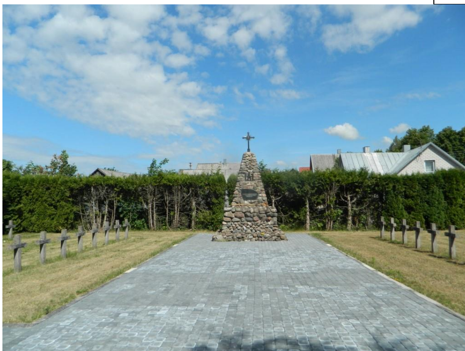
Nr. 2 Pavadinimas Rezistentų kapai iš P