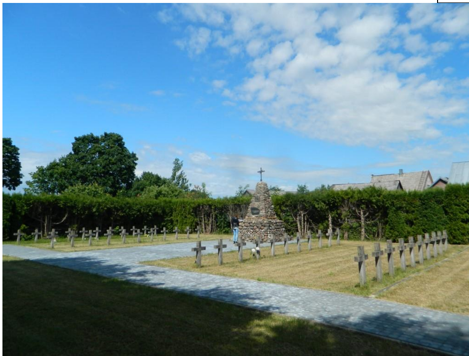
Nr. 1 Pavadinimas Rezistentų kapai iš PR